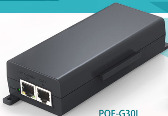
POE-G30I (1/2.5/5Gbps/Multi Gigabit)

30WATT GIGABIT/MULTI GIGABIT POE+ INJECTOR