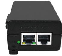
30W External Power