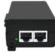
30W Internal Power