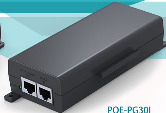
POE-PG30I (10/100/1000M Gigabit)