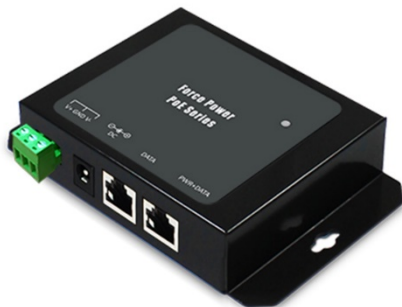
60 WATT MULTI GIGABIT (FPOE-DXG-60W)