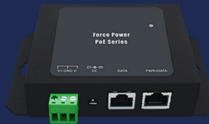
90 WATT MULTI GIGABIT (FPOE-DXG-90W)